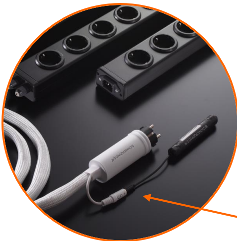
Anschluss CABLE PROTECTOR

Der Einsatz eines CABLE PROTECTOR bezieht sich nur auf den Schutz des Kabels und ersetzt nicht den Einsatz eines OPERATOR PROTECTOR oder POWER GUARD.